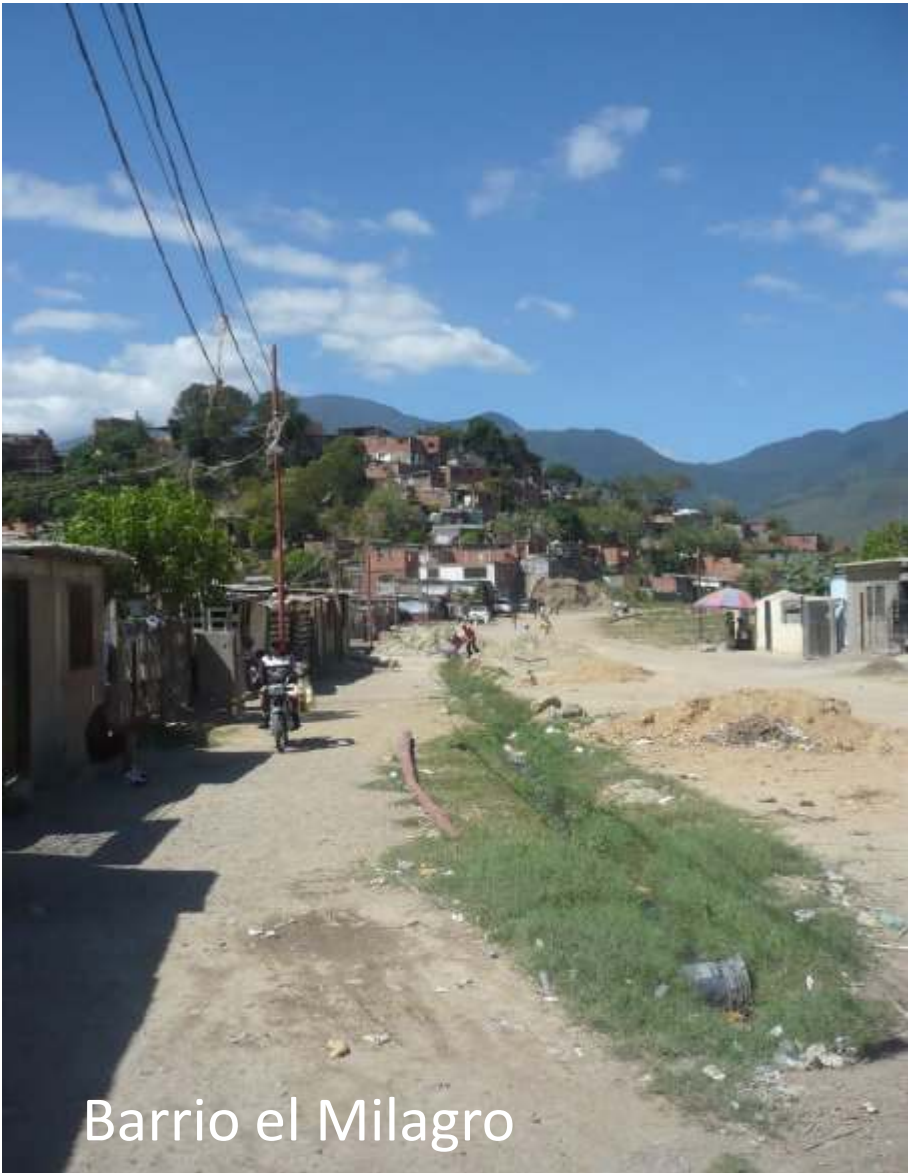
Barrio el Milagro